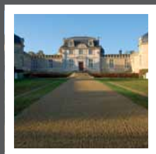
Château de Malle