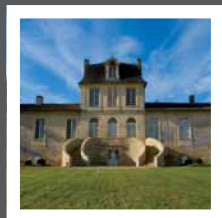
Château de Myrat