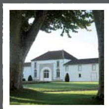
Château La Tour Blanche