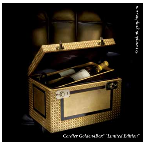
Cordier Golden4Box® "Limited Edition"

Grand Prix International Vinexpo : remise d'un prix spécial aux 3 meilleurs scores réalisés par les joueurs internationaux.